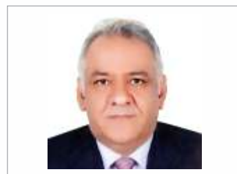
Chairman of the Board